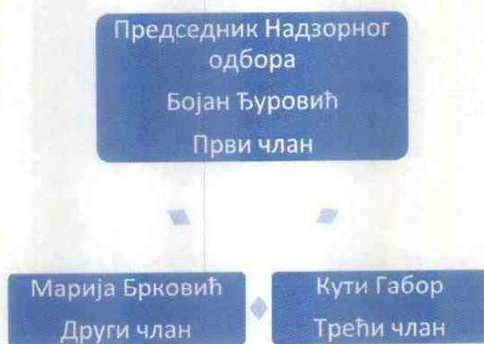
Шема 1: Чланови Надзорног одбора јавног предузећа „Водоканал“ Бечеј за 2018. годину