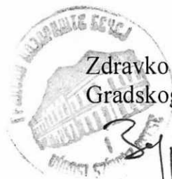
Zdravko Petrović, direktora Gradskog pozorišta Bečej

Plan i program rada Gradskog pozorišta Bečej je donet od strane direktora Gradskog pozorišta još 11.01.2021. godine kada je i usvojen na sastanku Upravnog odbora, ali greškom nije dostavljen Opštini Bečej na usvajanje.